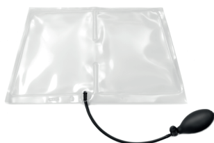
Aufblasbare Zweikammer-Lendenstütze (Standard)