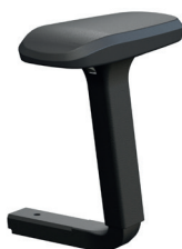
2D (Serie 2) Armlehne verstellbar in der Höhe 19-29 cm und in der Breite 39-52 cm