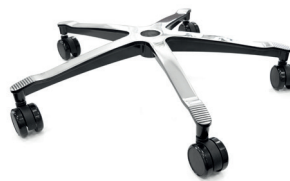
Fußkreuz in poliertem Aluminium (Extras)