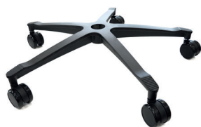
Fußkreuz in schwarzem Kunststoff (Extras)