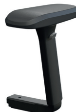
4D (Serie 3) Armlehne verstellbar in der Höhe 19-29 cm und in der Breite 39-52 cm. Armlehnenauflage um 360° drehbar